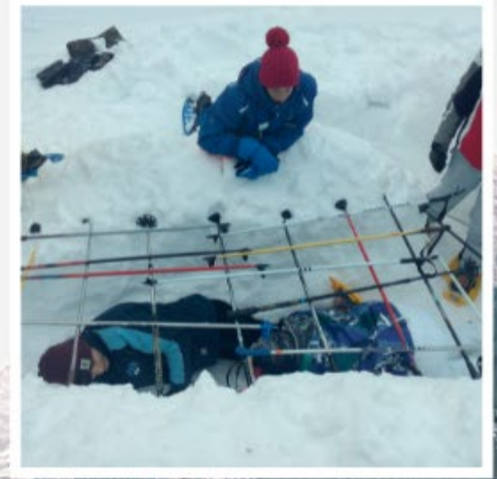
COSTRUZIONE DI UN RIFUGIO