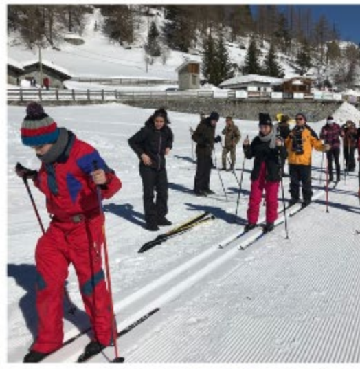
SCI DI FONDO