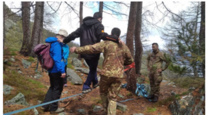
La "terapia dell'avventura" ad Arpy

Si è svolto ad Arpy, la scorsa settimana, il progetto proposto, organizzato e cofinanziato dall'associazione culturale Camici&Pigiarni, dalla Fondazione Tender To Nave Italia, dal Liceo scientifico e delle scienze umane Regina Maria Adelaide di Aosta - attraverso i Fondi regionali dei Percorsi per le Competenze Trasversali e l'Orientamento (ex Alternanza Scuola Lavoro) - e dalla Fondazione comunitaria Valle d'Aosta. Un'esperienza di inclusione tra ragazzi, con disabilità e non, al di fuori dell'ambiente scolastico, in un'ottica di accoglienza della reciproca diversità.